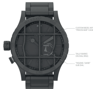
Black SANITARIUM SU RICHIESTA 650€