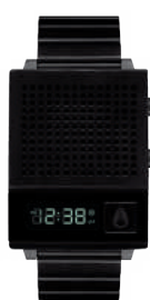
All Black A1266-001 160€