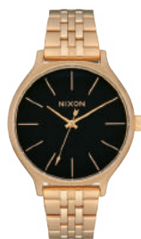
Clique Gold / Black a1249 - 513 130€