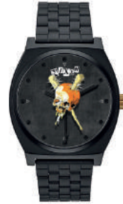
Black / PUSHEAD 3108 125€