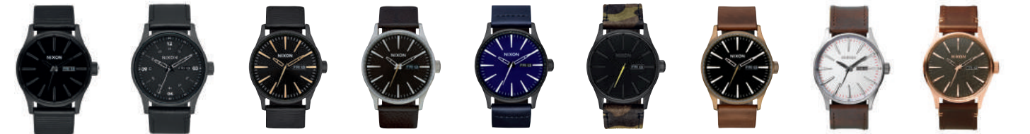
All Black / Black 1147 Bronze Cerakote / Black 2949 All Black / White / Gold 2987 Dark Cedar / Brown / Dark 2986 All Black / Dark Blue 2668 Black / Camo / Volt 3054 Brass / Black / Brown 3053 Silver / Brown 1113 Rose Gold / Gunmetal / Brown 2001