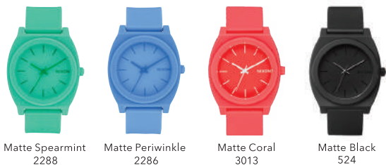
Matte Spearmint 2288 Matte Periwinkle 2286 Matte Coral 3013 Matte Black 524