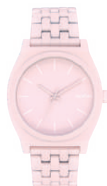
All Matte Petal a045 - 3163 99€