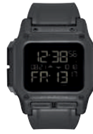
All Black 001