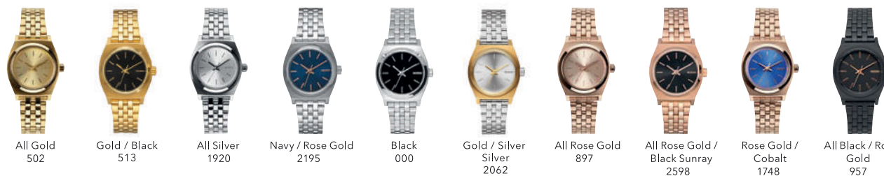
All Gold 502 Gold / Black 513 All Silver 1920 Navy / Rose Gold 2195 Black 000 Gold / Silver Silver 2062 All Rose Gold 897 All Rose Gold / Black Sunray 2598 Rose Gold / Cobalt 1748 All Black / Rose Gold 957