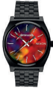
Black / HARDWIRED 3109 125€