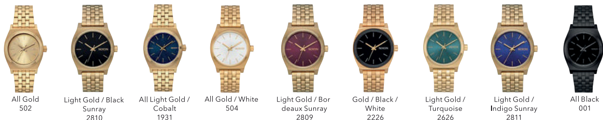
All Gold 502 Light Gold / Black Sunray 2810 All Light Gold / Cobalt 1931 All Gold / White 504 Light Gold / Bordeaux Sunray 2809 Gold / Black / White 2226 Light Gold / Turquoise 2626 Light Gold / Indigo Sunray 2811 All Black 001