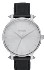
Silver / Artifact a108 - 3149 130€