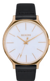
Clique Leather Gold / White / Black a1250 - 1964 130€