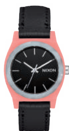
Peach / Black 3188