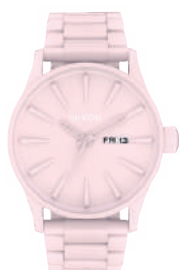
All Matte Petal a356 - 3164 210€