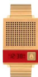
All Gold A1266-502 160€