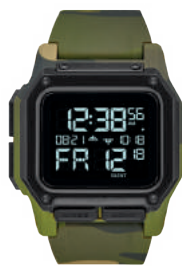
Tropic Multicam a1180-3175 150€