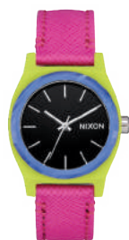
Lime / Magenta 3152