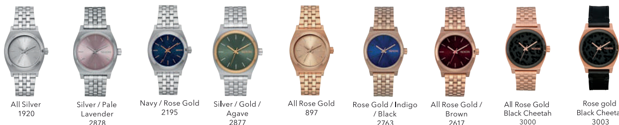
All Silver 1920 Silver / Pale Lavender 2878 Navy / Rose Gold 2195 Silver / Gold / Agave 2877 All Rose Gold 897 Rose Gold / Indigo / Black 2763 All Rose Gold / Brown 2617 All Rose Gold Black Cheetah 3000 Rose gold Black Cheetah 3003