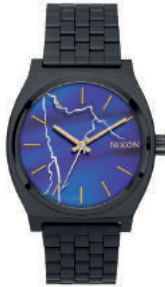
Black / RIDE THE LIGHTNING 3107 125€