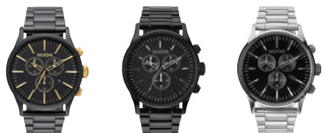
Matte Black / Gold 1041 All Black 001 Black 000