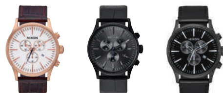
Rose Gold / Brown Gator 2459 Black Gator 1886 All Black / White 756