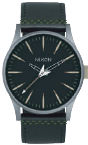
Gunmetal/ SEEK & DESTROY 3106 200€