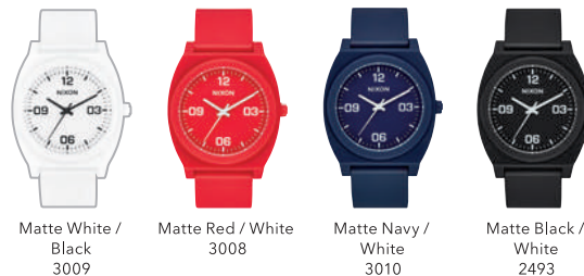
Matte White / Black 3009 Matte Red / White 3008 Matte Navy / White 3010 Matte Black / White 2493