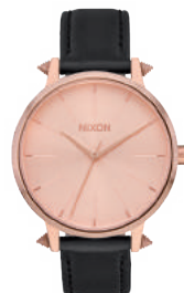
Rose / Artifact a108 - 3147 130€