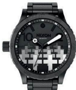
Black MASTER OF PUPPETS 3105 500€