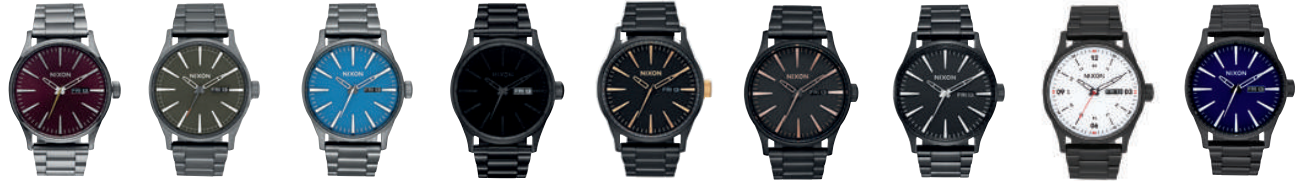
Gunmetal / Deep Burgundy 2073 All Gunmetal / Slate / Orange 2947 Navy / Gunmetal 2854 All Black / Black 1147 Matte Black / Gold 1041 All Black / Rose Gold 957 All Black 001 Black / White 005 All Black / Dark Blue 2668