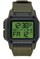
Surplus / Carbon 3100