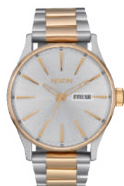
Silver / Gold a356 - 1921 210€