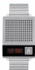
Black A1266-000 160€