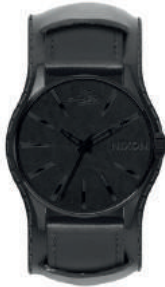
Black BLACK ALBUM 3101 260€