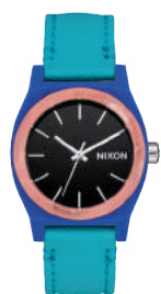
Blue / Green 3153