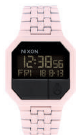
All Matte Petal a158 - 3164 120€