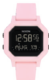
Pale Pink a1210 - 3154 99€