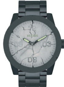
Black AND JUSTICE FOR ALL 3104 260€