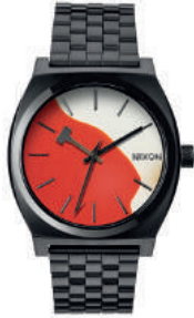
Black / KILL EM' ALL 3102 125€