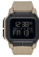
All Sand 2711