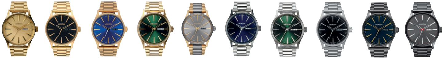
All Gold 502 All Gold / Black 510 All Gold / Blue Sunray 2735 Gold / Green Sunray 1919 Gunmetal / Gold 595 Blue Sunray 1258 Green Sunray 1696 Black Sunray 2348 Gunmetal / Indigo 2983 Gunmetal 131