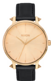
Gold / Artifact a108 - 3148 130€