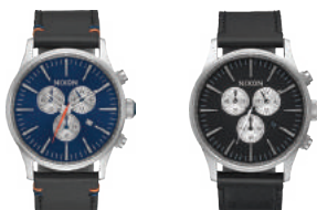
Blue Sunray 1258 Black 000