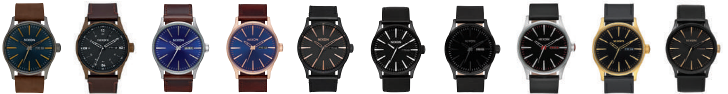
Gunmetal / Indigo / Brown 2984 Bronze Cerakote / Brown 2950 Blue / Brown 1524 Rose Gold / Navy / Brown 2867 All Black / Rose Gold 957 Black / White 005 All Black 001 Black 000 Gold / Black 513 Matte Black / Gold 1041