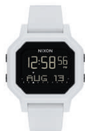
White a1210 - 100 99€