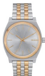
Silver / Gold a045 - 1921 99€