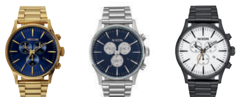
Gold / Blue Sunray 1922 Blue Sunray 1258 All Black / White 756